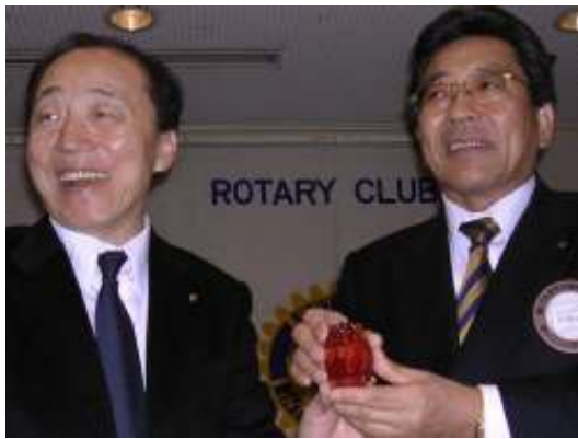
蕭会長から下向会長へ記念品が手渡された