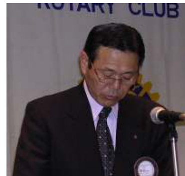
議事録を発表する有田副会長