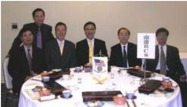
台北市南港扶輪社の方々