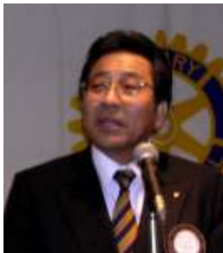
お礼を述べる下向会長